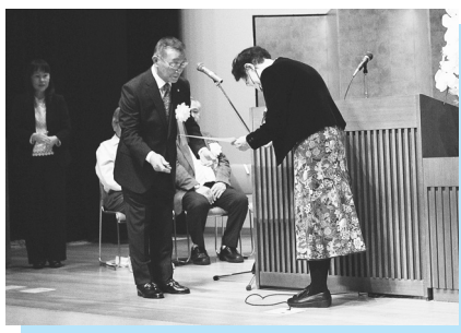
▲永年ご協力いただいた役員方へ感謝状贈呈