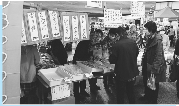
▶里親啓発(信太学園) ▲盛況の模擬店 (母子寡婦福祉会)