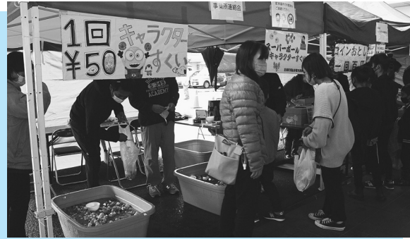
▶ 駄菓子くじ引き (ピープルハウス忠岡) ▶ キャラクターすくい (事業所連絡会)