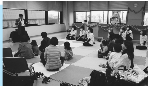
▶ 運動器症候群チェック (泉大津薬剤師会) ▶ こども広場 (民生委員児童委員協議会)