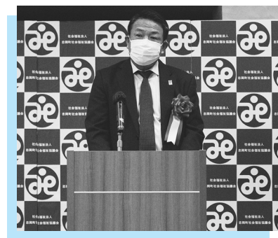
▲あいさつする杉原町長