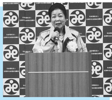
▲あいさつする上ノ山会長