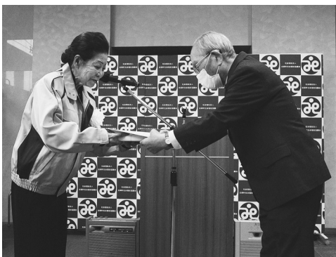
▶ 永年ご協力いただいた 役員方へ感謝状贈呈

新型コロナウイルス感染症の影響が長引く中、本協議会と致しましては「ウイズコロナ」を見据え、今後も社協役員が心をひとつにして、町行政と一体的に策定した第4次地域福祉計画・地域福祉活動計画の基本理念である『つながり つどい 支え合う 地域共生のまち ただおか』の実現のため、関係機関との連携を図りながら引き続き事業推進をして参りますので、宜しくお願い申し上げます。